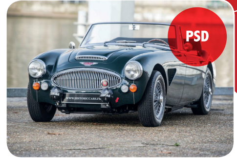
AUSTIN HEALEY 3000 1967

Toutes les pièces du châssis, de la carrosserie, du moteur et de l'intérieur, y compris le bois, ont été restaurées et/ou sont NOS. Avec sa petite préparation moteur, la voiture est un rêve à conduire !