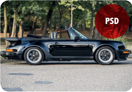
PORSCHE 930 TURBO CABRIOLET

Le meilleur moyen pour vendre ou acheter une voiture de course historique, une voiture de rallye, un camion, une remorque, des pièces détachées, des accessoires.