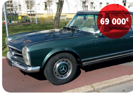
MERCEDES 280 SL PAGODE

Cette Mercedes 280 SL d'origine française a le même propriétaire depuis 1984. Elle a été restaurée de A à Z en 1997. Elle a parcouru 25 000 km depuis.