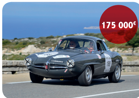
ALFA ROMEO GIULIETTA SS

Cette Alfa Romeo Giulietta Sprint Special de 1964 a fait l'objet d'une restauration et d'une préparation sans contrainte de coût.