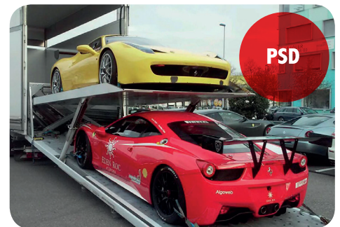
TRANSPORT & LOGISTIQUE

TRANSFRET AUTO vous propose un catalogue de solutions clé en mains, pour vos salons, meetings, journées d'essais... et ce dans toute la France, en Europe et vers les pays limitrophes.