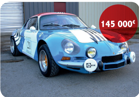
ALPINE A110 1600 GROUPE 4

Bénéficiez de 50% de réduction sur votre première annonce en utilisant le code promo : PROMO50